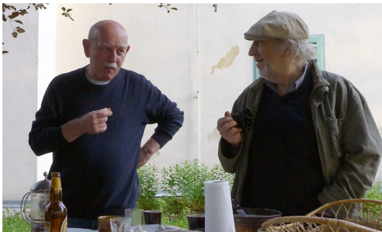
Foki a Kačka jedli.