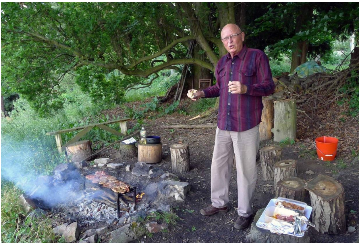
Cancidlo se věnoval grilování