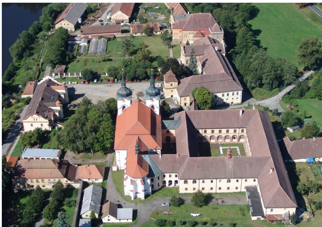
Premonstrátský klášter v Želivu, místo našeho letošního výletu