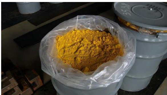
Při sušení vzniká uranový koncentrát, kterému se říká žlutý prášek.

Ruský těžební podnik Dalur, který je součástí koncernu Rosatom, používá české řešení pro sušení uranu. Majitel firmy Sušárny Praha Bojan Čermák dokáže pomocí fluidní sušárny snížit vlhkost z třiceti procent na jedno až dvě procenta. Rusové mají zájem o další dodávku sušárny do Burjatska.